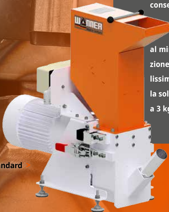
Modello B 08.10 Standard

La varietà di tramogge di carico e di configurazioni consente di adattare con facilità il granulatore alle specifiche esigenze. Grazie al design compatto con motoriduttore, lo spazio occupato è ridotto al minimo. Questo rende il granulatore Baby una soluzione eccellente per installazione con presse di piccolissime dimensioni e sistemi di sorting. La Serie Baby è la soluzione ideale per micro-iniezione con portate fino a 3 kg/h.